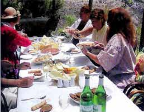
damya, waar de cursisten vaak lunchen