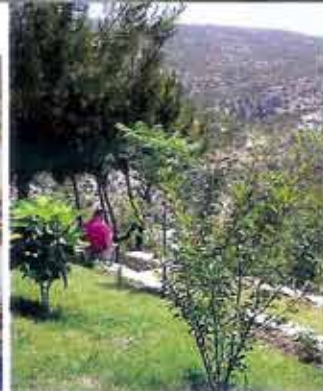
Tot rust komen in het groen