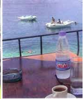
Even rust, kopje koffie op het terras en genieten van de blauwe zee