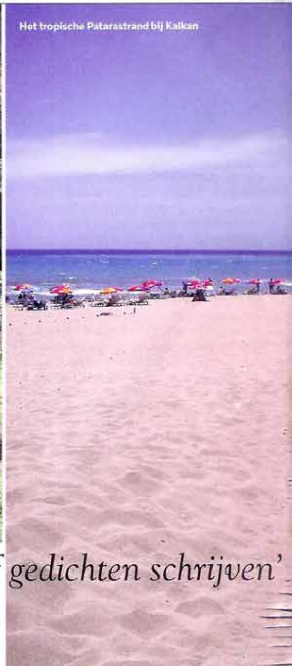
Het tropische Patastraand bij Kalkan