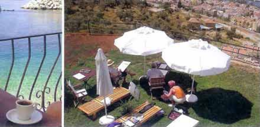
Cursisten slapen in hotel Pirat. Het hotel heeft een tuin en een zwembad

het regelen van publiciteit, het schrijven van teksten, het afsluiten van contracten, het zoeken van docenten. 'Alle puzzelstukjes vielen in elkaar. Het was alsof ik hier onbewust al die jaren naartoe had gewerkt.'