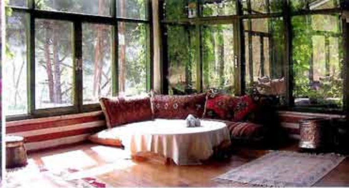
Binnen is restaurant Bodamya Turkser dan Turks