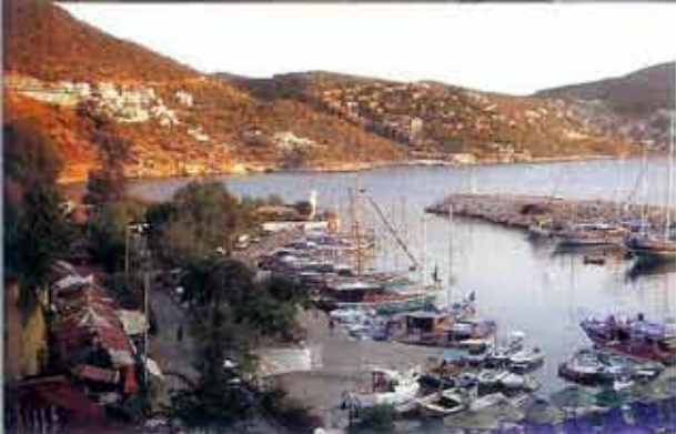
Uitzicht op de haven in Kalkan